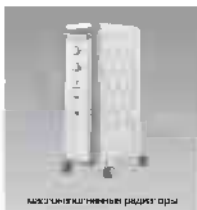
максимально высокие радиаторы