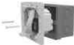
Рисунок 6. Установка терморегулятора в монтажную коробку

3. Аккуратно отсоедините шлейф соединяющий лицевую панель с основным корпусом устройства. Закрепите корпус в монтажной коробке и зафиксируйте ее двумя винтами (рисунок 6).