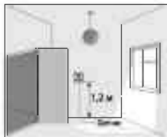
Рисунок 2. Схема размещения терморегулятора в помещении

Термостат должен быть установлен (закреплен) на стене, со свободной циркуляцией воздуха вокруг прибора. Терморегулятор должен быть установлен вдали от любых источников тепла (например, от нагревательных приборов), дверей и окон, изолирован от прямых солнечных лучей и внешней стены (рис. 2).