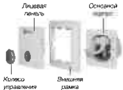
Рисунок 3. Монтаж и схема подключения терморегулятора

1. Подготовить отверстие в стене под монтажную коробку. Подвести силовой кабель электрической сети, кабель питания системы «тёплый пол» и датчика температуры пола в гофрированной трубе. Зафиксировать монтажную коробку. Произвести подключение к терморегулятору согласно рисунку 4.