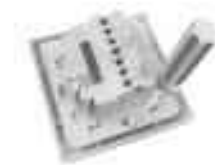
Рисунок 5. Демонтаж лицевой панели

2. Используя отвертку, аккуратно отсоедините лицевую панель от основного корпуса устройства, как показано на рисунке 5.