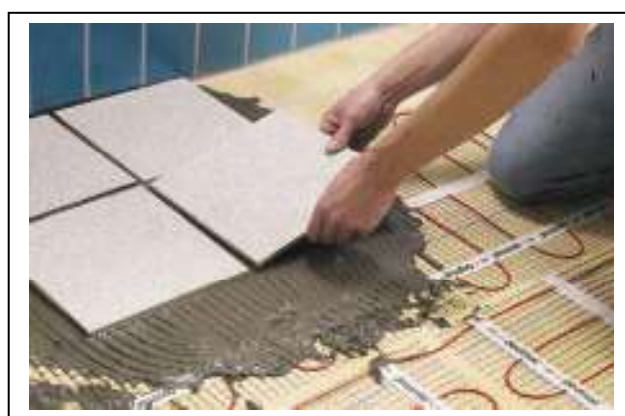
Рис. 3. Монтаж нагревательного мата DTIR-150 в ванной комнате на старую плитку.