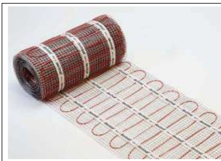
Рис. 1. Нагревательный мат DTIR-150.

Нагревательные маты DEVIcomfort 150T / DTIR-150 (рис. 1) применяются для внутренней установки. Используются в ремонтируемых и тонких полах непосредственно под покрытие пола без формирования толстой цементной стяжки и устанавливаются в основном под плитку с плиточным клеем. Кабели предназначены только для прокладки в земле и бетоне.