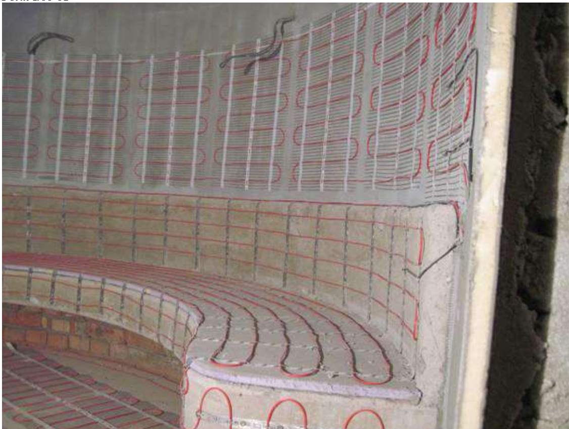
Рис. 4. Монтаж нагревательного мата DEVIheat™ 150S (DSVF-150) на стене в турецкой бане.