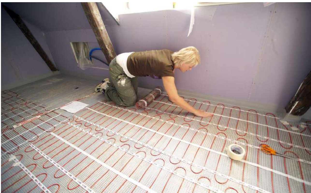
Рис. 3. Монтаж нагревательного мата DEVIheat™ 150S (DSVF-150) на основание из плит ГВЛ под плитку.

При выборе нагревательных матов необходимо учитывать допустимый разброс параметров, приведенных в технических характеристиках, и возможные отклонения напряжения питающей сети.